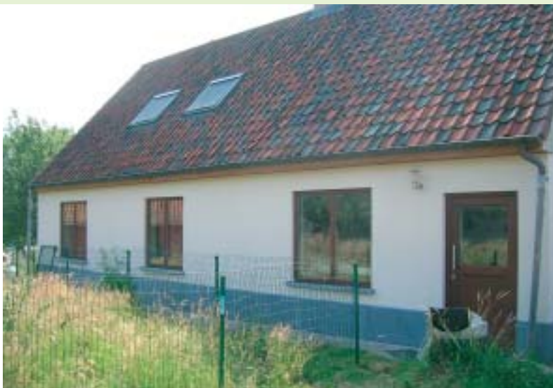
De voorgevel heeft het oorspronkelijk karakter behouden.

De bouwheren vinden naast het energieaspect ook regenwateropvang zeer belangrijk. Daarom plaatsten ze een regenwaterput van 10.000 liter. Met het regenwater spoelen ze het toilet, begieten de tuin, poetsen en ze kunnen zelfs een regenwaterbad nemen. Het vuile water komt eerst in een septische put of een vet- vanput voor het keukenwater terecht, waarna het naar