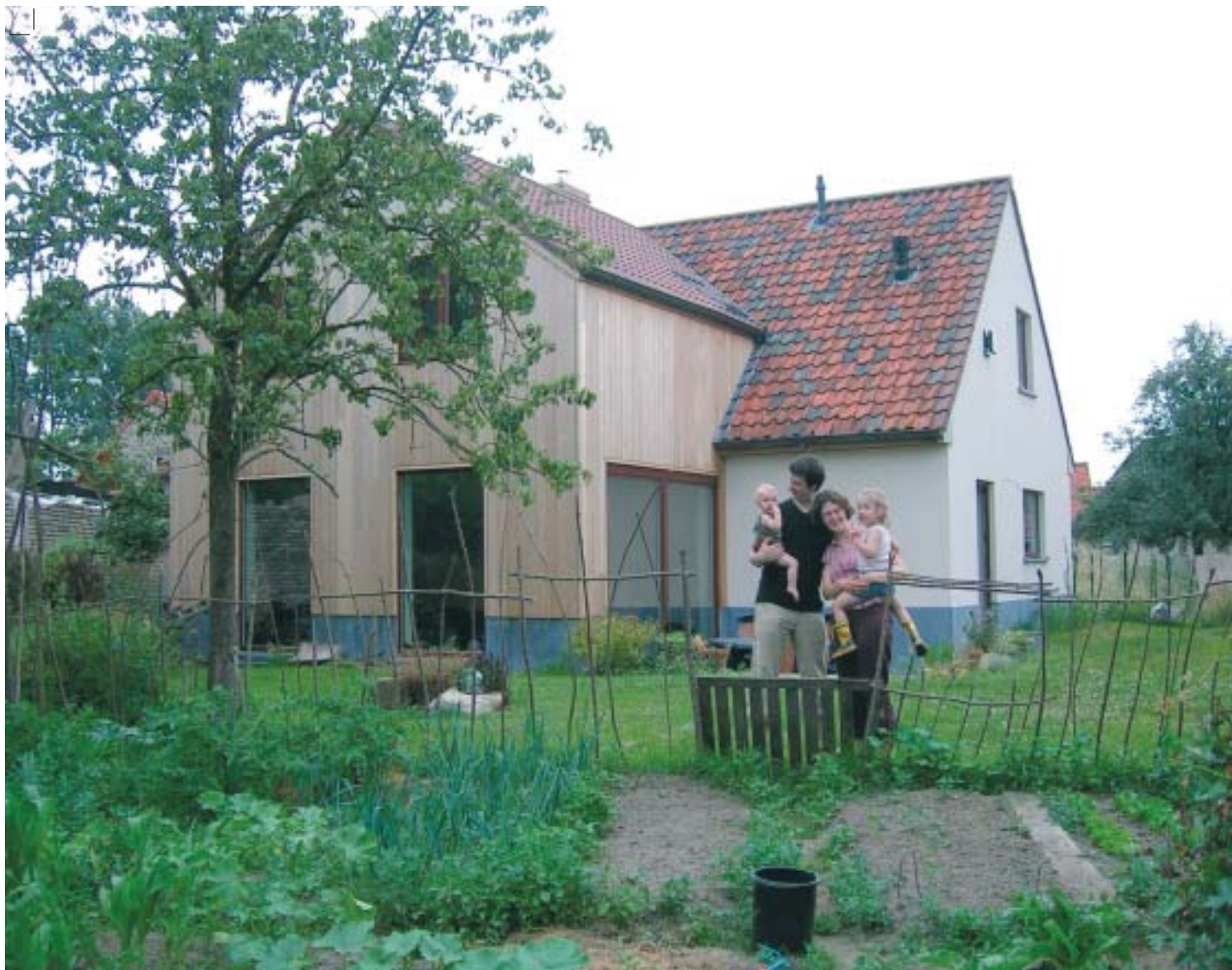
Een houtskeletbouw vergroot de leefruimte in een oude boerderij. Foto's Vibe.