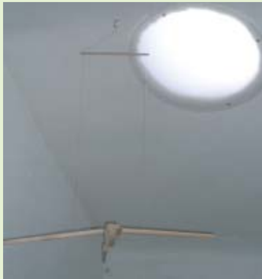
Deze koepel laat zacht het natuurlijke licht op de overloop schijnen.

ecologische woning volgens VIBE. Hoewel de woning op vele andere punten vooruitstrevend is op ecologisch vlak.