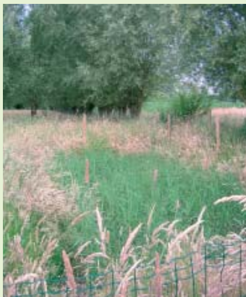
Het percolatierietveld zuivert al het afvalwater voor afvoer naar de gracht.